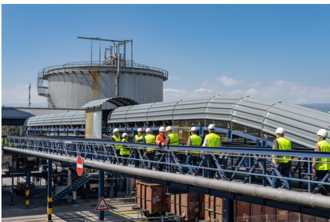
Betriebsbesichtigung bei der Zucker AG