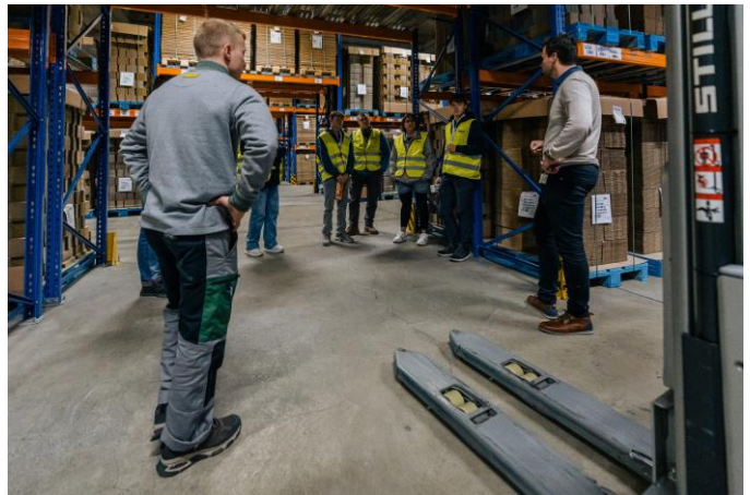
Rundgang mi-lehr backstage bei Marti Logistik

www.bern-cci.ch , hiv-lyssumgebung@bern-cci.ch