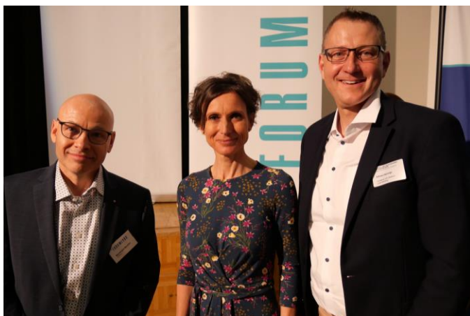
Forum Lyss Partneranlass

Der Wirtschaftsanlass in Kooperation mit dem Forum Lyss stand im Zeichen der Politik: Pascale Bruderer referierte zu ihrem Werdegang und zu wirtschaftspolitischen Themen, welchen sie in ihrer Amtszeit begegnet ist.