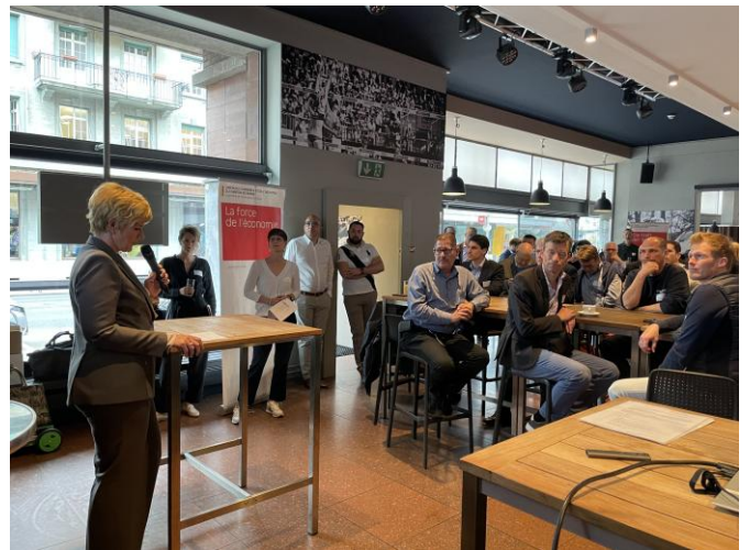
HIV-Zmorge mit der IV im Rotonde Biel

Der HIV-Zmorge fand am 11. Juni 2024 im Rotonde Biel in Zusammenarbeit mit der IV statt. An der Veranstaltung lernten die Unternehmen die verschiedenen Leistungen der IV-Stelle Kanton Bern kennen und erfuhren, warum und wann es sich für ein Unternehmen lohnt, mit der IV zusammen zu arbeiten.