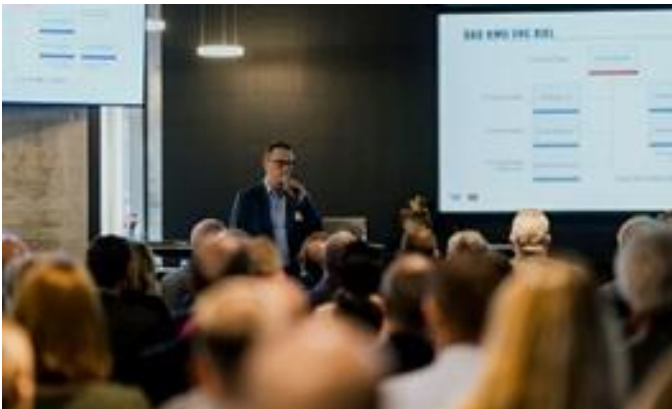
Beim EHC Biel in der Tissot Arena

Am 28. November 2024 fand das erste Mal ein Partneranlass der beiden Seeländer Sektionen statt, was könnte mehr verbinden als der Sport, daher besuchten über 120 Mitglieder der HIV-Sektion Biel-Seeland / Berner Jura und Sektion Lyss-Aarberg den EHC Biel.