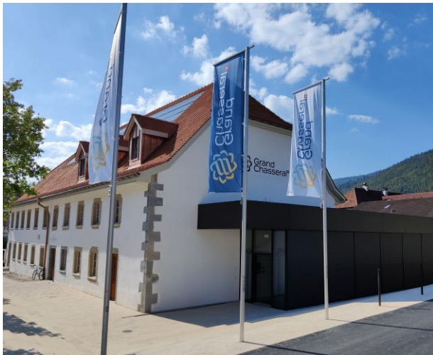
In den Räumlichkeiten la Couronne

Am 19. März 2024 fand die Generalversammlung im neu eröffneten la Couronne statt. Im Gebäude La Couronne in Sonceboz sind alle Aktivitäten unter der Marke Grand Chasseral zentralisiert. Patrick Linder ermöglichte einen Einblick in das neue Projekt im Grand Chasseral.