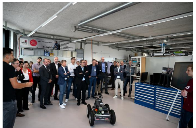
Im SCDH Nidau

Am 10. September 2024 fand der HIV-Lunch in den Räumlichkeiten der hftm zum Thema Robotertechnik statt. Wussten Sie, dass die hftm eines der weltbesten Roboterteams weltweit stellt, und das auch noch mit dem vergleichsweise kleinsten Budget? Mit der hftm ist unsere HIV-Sektion eng verbunden. Die Berufslehre ist eines unserer Steckenpferde und wir engagieren stark für das duale Bildungssystem.