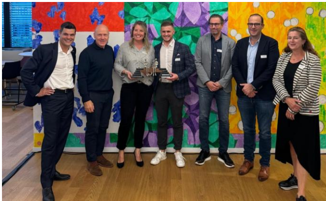
Bei der BEKB in Biel

Regionale Wirtschaftsakteure, u.a. wir, die BEKB und das Forum für die Zweisprachigkeit haben am 17. September 2024 zum dritten Mal den Preis Effort Bilinguisme Economie verliehen. Der Preis wurde an das Unternehmen Fromages Spielhofer SA verliehen.